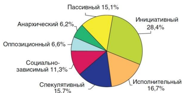
Поведенческие типы российской молодежи в соответствии с ее гражданской идентичностью

Из социологических исследований мы видим, что молодёжь и здесь делится на разные типы. К каждому типу требуется свой подход взаимодействия. Кроме того, у нас, взрослых, должна быть чёткая гражданская позиция, причём не агрессивная, а позитивная, то есть созидательная и деловая – нацеленная не только на причины кризиса, а прежде всего на поиск возможностей улучшения мира вокруг себя. Работая в этой области, библиотекари очень часто попадают в ловушки стереотипного мышления. Их много.