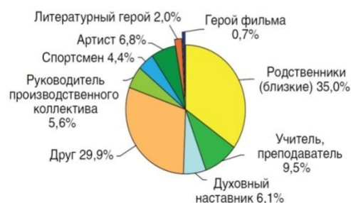
Кто выступает в качестве идеала для молодежи (нормированный показатель для 25% молодежи, у которой есть идеал, принятой за 100%)

Если говорить образно, то нужно предложить ребятам увлекательную игру с конкретными правилами, которые нельзя нарушать. Но в этой игре обязательно