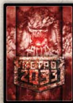
Угрозы второго этапа