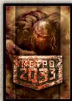
Угрозы первого этапа